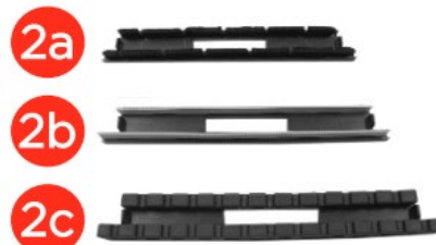
Насадка з щетиною + Насадка з гумою + Насадка для килимових покриттів