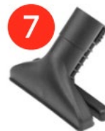
Насадка для використання функцій пара і всмоктування