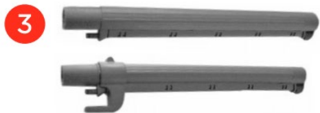
Подовжувальна трубка + подовжувальна трубка з фіксатором