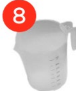
Ємність для закиву води