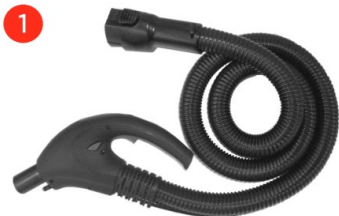
Гнучкий паровий шланг з функцією всмоктування