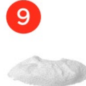
Захисне тканинне покриття