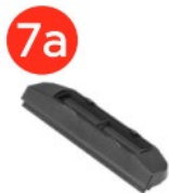
Резинова вставка, 200 мм