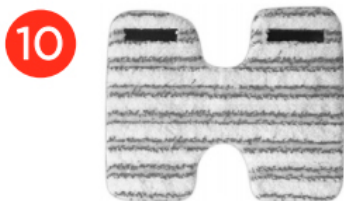
2 Універсальних підстилки