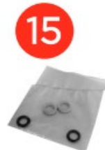
Запасні ущільнювальні кільця