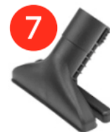
Насадка для використання функцій пара і всмоктування