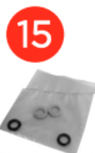
Запасні ущільнювальні кільця