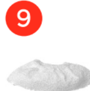
Захисне тканинне покриття