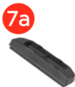
Резинова вставка, 200 мм